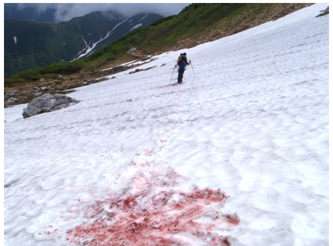
残雪期：ベンガラマーキングの例